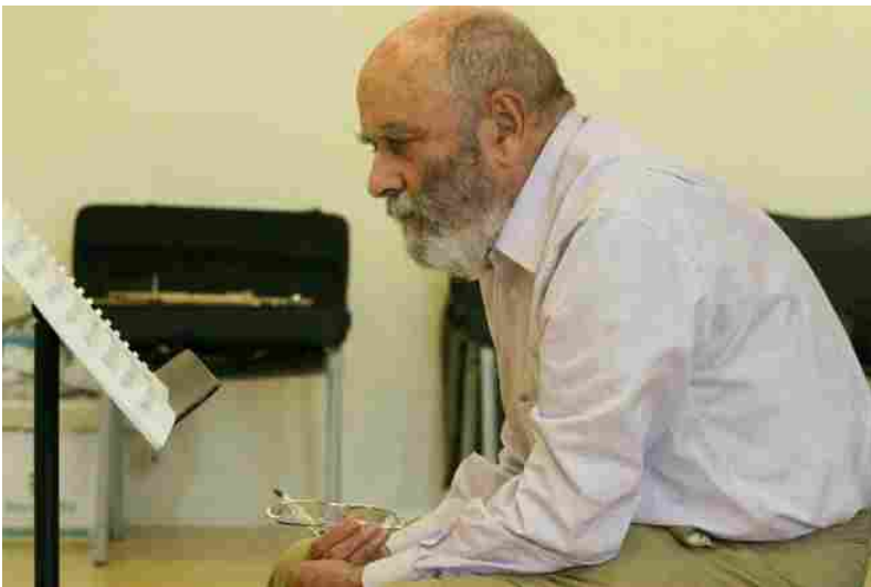
El compositor Luis de Pablo, León de Oro de la Bienal de Música de Venecia