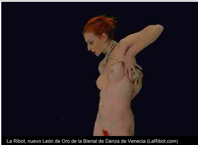
La Ribot, nuevo León de Oro de la Bienal de Danza de Venecia (LaRibot.com)

Su práctica artística se inició con los vientos de libertad de la España de los ochenta y ha tenido un enorme impacto en el panorama de la danza contemporánea. Tomando libremente el vocabulario del teatro, las artes visuales, la performance y el cine, para ella la danza es un punto de partida para experimentos múltiples en el lenguaje del cuerpo.