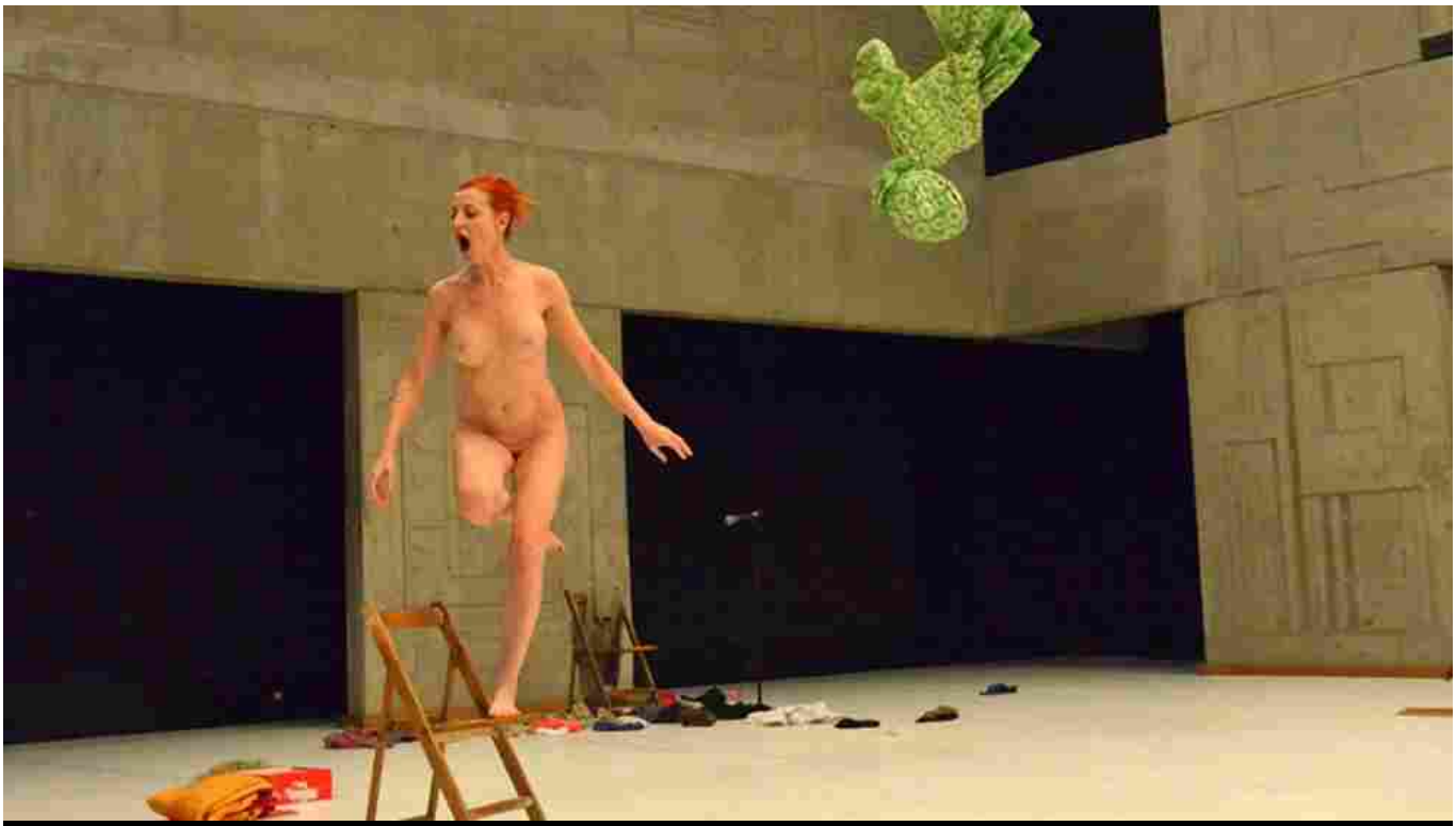
La Ribot en una de sus performances

• El compositor vasco y la coreógrafa hispanosuiiza reciben los máximos galardones de las Bienales de Música y Danza