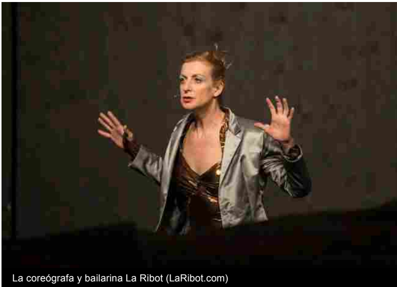
La coreógrafa y bailarina La Ribot

La coreógrafa canadiense Marie Chouinard , directora de la Bienal de Danza, ha definido a La Ribot –que actuará dentro del festival Grec de Barcelona este mes de julio en Please, please, please – como “una outsider , que es lo que son los grandes artistas. Bach lo fue en su tiempo. Es necesario para crear una nueva senda”. Para Chouinard, La Ribot es “una gran señora extravagante del arte contemporáneo , figura señera de la danza actual, y su obra rigurosa y radical crítica y se ríe con la metamorfosis, la hibridación, el absurdo y la libertad”.